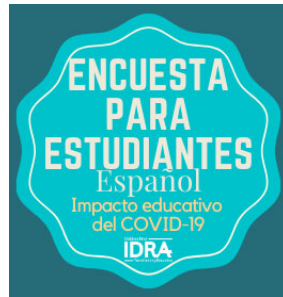
Encuesta para estudiantes