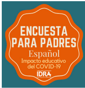
Encuesta para padres