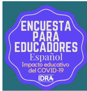
Encuesta para educadores